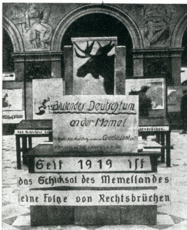
Die Memel-Ausstellung in der Technischen Hochschule zu Berlin-Charlottenburg

Nacionalsocialistinė vokiečių propaganda taip pat naudojo briedžio simbolį tekstams ir Vokietijoje rengiamoms parodoms apie „atplėstos“ Klaipėdos krašto problemą iliustruoti. Tai galima pamatyti iliustracijoje apie 1934 m. Berlyne surengtos parodos vizualizaciją, kurios pagrindinis leitmotyvas – susirūpinimas vokiškumo išlikimu prie Nemuno: